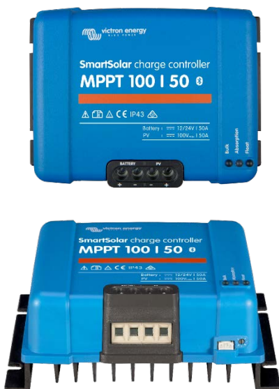
SmartSolar Lade-Regler MPPT 100/50

Apple und Android Smartphones, Tablets und weitere Geräte. - Color Control-Panel